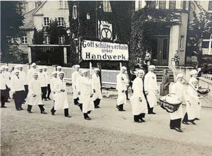
Aus dem Fotoarchiv der Familie Pech stammt diese Aufnahme vom Festumzug der Handwerker. Hier ist die Villa Hildebrandt noch besser zu erkennen als auf unserem Suchfoto.

Czornebohstraße stehen zwei Gebäude, zu erkennen ist auch das alte Schützenhaus und das Gebäude der ehemaligen Ziegelei, die der Ausgangspunkt für das spätere Betonwerk Schuster war.