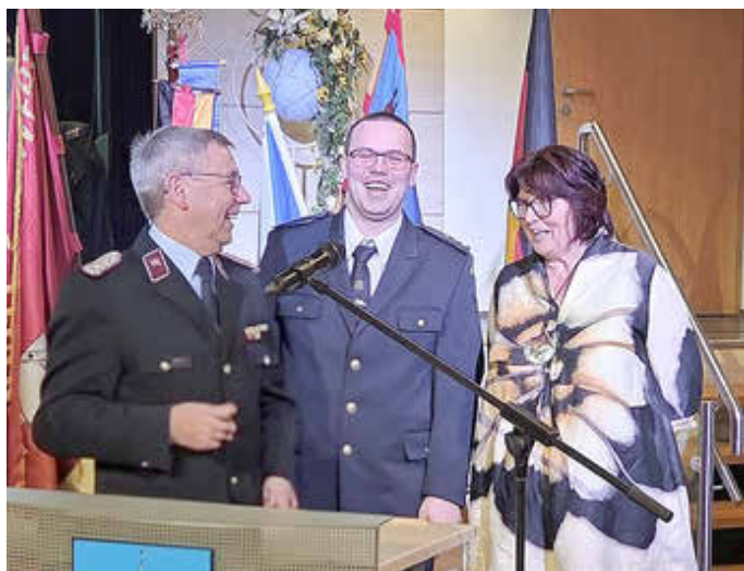
Auch eine Delegation der Partnerfeuerwehr aus Krizany (CZ) wohnte der Versammlung bei.