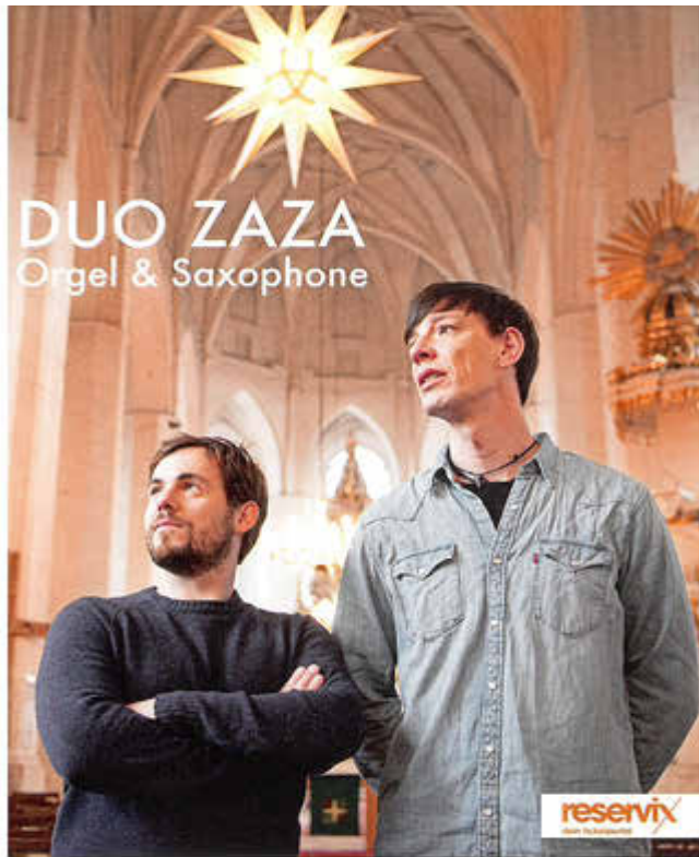
DUO ZAZA (Orgel & Saxofon) - Konzert in der Dorfkirche Cunewalde Freitag 01.05.2026 um 17:00 Uhr

Tickets erhältlich in den regionalen Tourist-Infos, den DDV-Lokalen sowie an der Abendkasse und online bei reservix.de